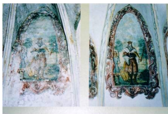
Bild 13: Entfeuchtungsprojekt Kirche St. Marein (Stmk), bekannt aus ORF „Modern Times“ 2003