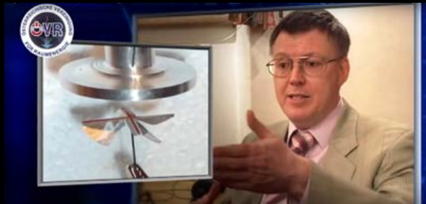
Das Flügelrad Experiment