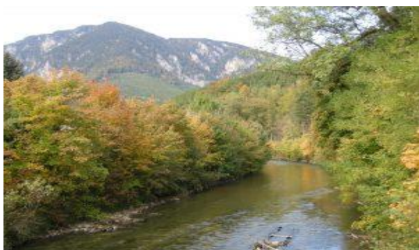
aus dem Schwarzatal